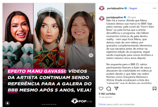
Imagem 1: Efeito Manu Gavassi