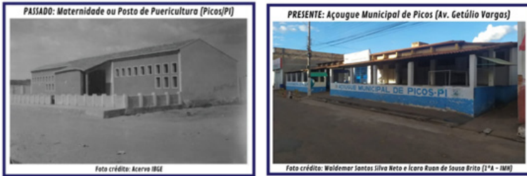
Figura 01 - Maternidade ou Posto de Puericultura.